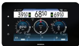
ECRAN TACTILE MULTIFONCTION 7"