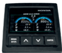
AFFICHAGE MULTIFONCTION 4,3"