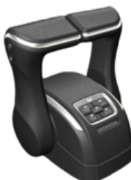
PUPITRE SIMPLE OU DOUBLE POUR BF300 ET BF350