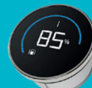
SVH85 & SVH52 SATELLITE